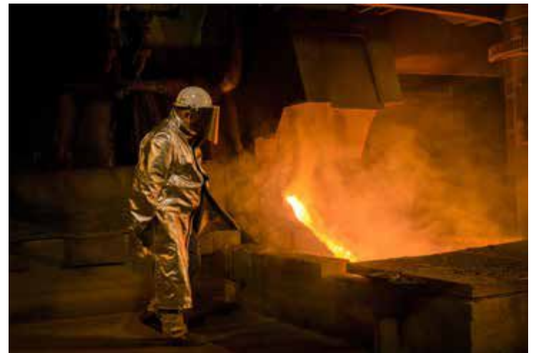
Til det nye YSK-studiet som startar opp til hausten, har skulen i indre Ryfylke gjort avtale om læreplassar ved smelteverket Eramet Norway Sauda.

– Desse elevane vil vere verdifulle for oss både i dei fire YSK-skoleåra og i høve til rekruttering på lang sikt, uttaler produksjonsdirektør Odd Hotvedt.